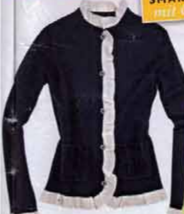
LADYLIKE Schwarzer Cashmere-Cardigan, mit weißen Rüschen gesäumt. Von Allude, ca. 219 €