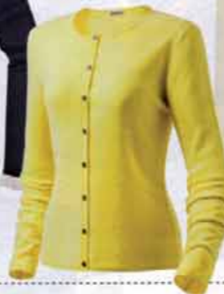
SPORTLICH Strickjackchen in Zitronengelb aus Cashmere. Von Repeat, ca. 170 €