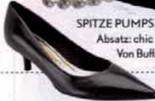
SPITZE PUMPS mit 5-cm-Absatz: chic & bequem. Von Buffalo, ca. 80 €