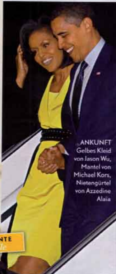
ANKUNFT Gelbes Kleid von Jason Wu, Mantel von Michael Kors, Nietengürtel von Azzedine Alaïa