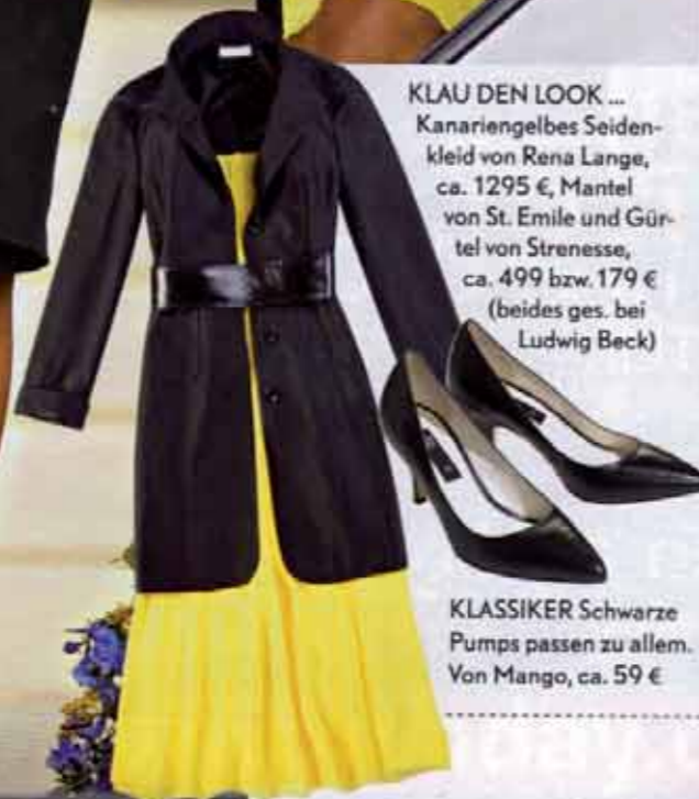
KLAU DEN LOOK ... Kanariengelbes Seidenkleid von Rena Lange, ca. 1295 €, Mantel von St. Emile und Gürtel von Strenesse, ca. 499 bzw. 179 € (beides ges. bei Ludwig Beck)