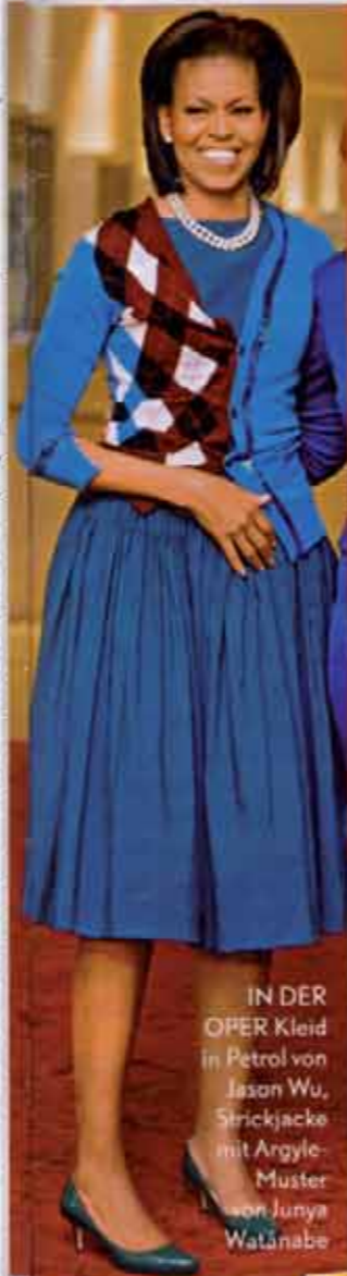
IN DER OPER Kleid in Petrol von Jason Wu, Strickjacke mit Argyle-Muster von Junya Watanabe

■ CLEVER auf Reisen sind sie, weil man mit ihnen offizielle, elegante Looks ganz unkompliziert etwas lässiger wirken lassen kann.