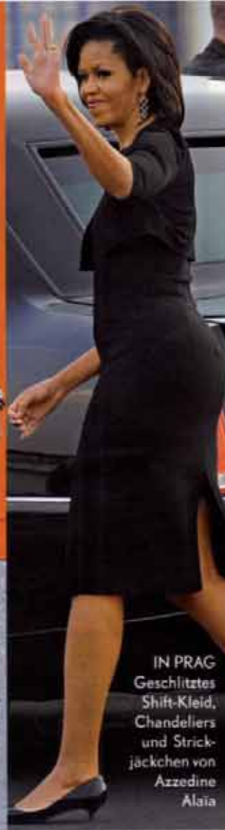
IN PRAG Geschlitztes Shift-Kleid, Chandeliers und Strickjackchen von Azzedine Alaïa