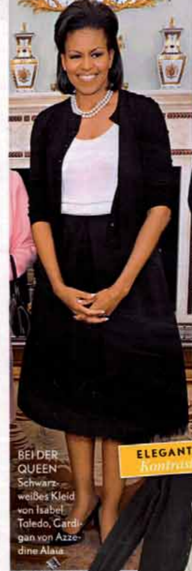
BEI DER QUEEN Schwarzweißes Kleid von Isabel Toledo, Cardigan von Azzedine Alaïa