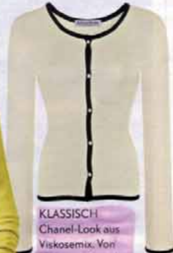
KLASSISCH Chanel-Look aus Viskosemix. Von Hofmann Streiche, ca. 135 €