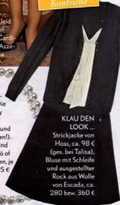
KLAU DEN LOOK ... Strickjacke von Hoss, ca. 98 € (ges. bei Talisa), Bluse mit Schleife und ausgestellter Rock aus Wolle von Escada, ca. 280 bzw. 360 €