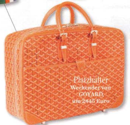
Platzhalter Weekender von GOYARD, um 2445 Euro