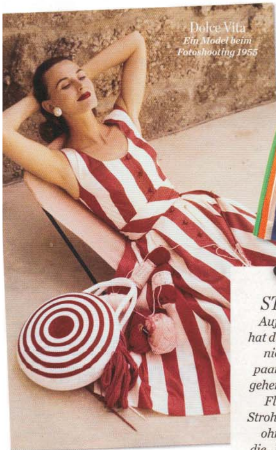
Dolce Vita Ein Model beim Fotoshooting 1955