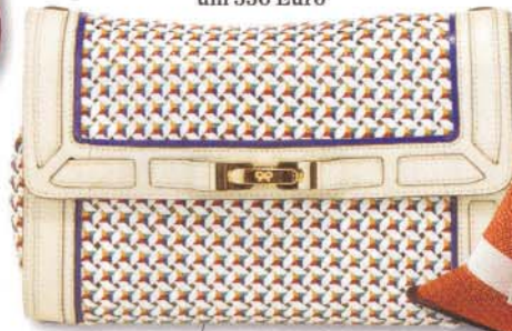
Rasterfahndung Tasche von ANYA HINDMARCH, um 550 Euro