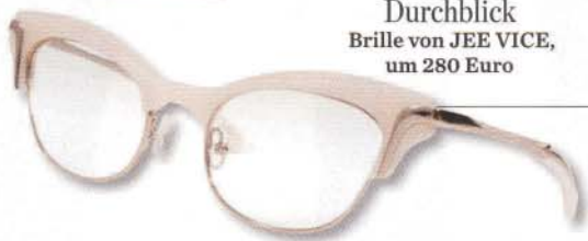
Durchblick Brille von JEE VICE, um 280 Euro