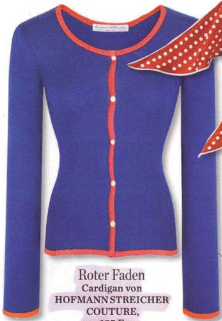
Roter Faden Cardigan von HOFMANN STREICHER COUTURE, um 135 Euro

Urlaubsreif? Dann schnell das bunte Streifenkleid einpacken und den Karobikini nicht vergessen