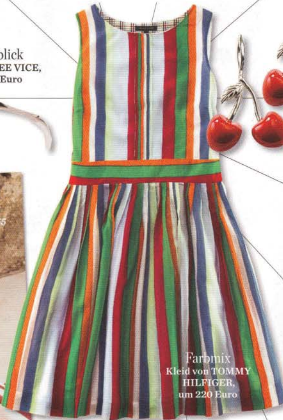
Farbmix Kleid von TOMMY HILFINGER, um 220 Euro