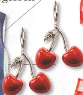
Lecker Ohrhinge von THOMAS SABO, um 80 Euro