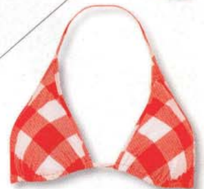
Karo-As Bikini von LAHCO, Set um 200 Euro